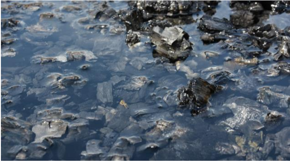
Abbildung 6 Kristallklares Löschwasser ist das beste Zeichen für einen sauberen Pyrolyseprozess.

Das Löschwasser kann man einige Stunden oder auch Tage im Meiler belassen. Durch den unteren Abfluss lässt es sich leicht ablassen. Das Löschwasser ist sauber und transparent, aber seifig und hat einen recht hohen pH-Wert. Während der hohe pH-Wert auf die ca. 10% bei der Pyrolyse ebenfalls entstehende Asche zurückzuführen ist, entsteht die Seife durch die Reaktion der Asche mit Pyrolyseölen, die beim Dämpfen der Kohle aus den Poren ausgetrieben werden. Dieses seifige Löschwasser eignet sich offenbar hervorragend zum Giessen von Obst- und Gemüsepflanzen , vertreibt Schnecken und Pilze und wirkt allgemein kräftigend auf die Pflanzen. Letztere Aussage beruht jedoch bisher nur auf eigenen Beobachtungen mit zwei Dutzend Pflanzenarten, systematische wissenschaftliche Untersuchungen stehen noch aus.