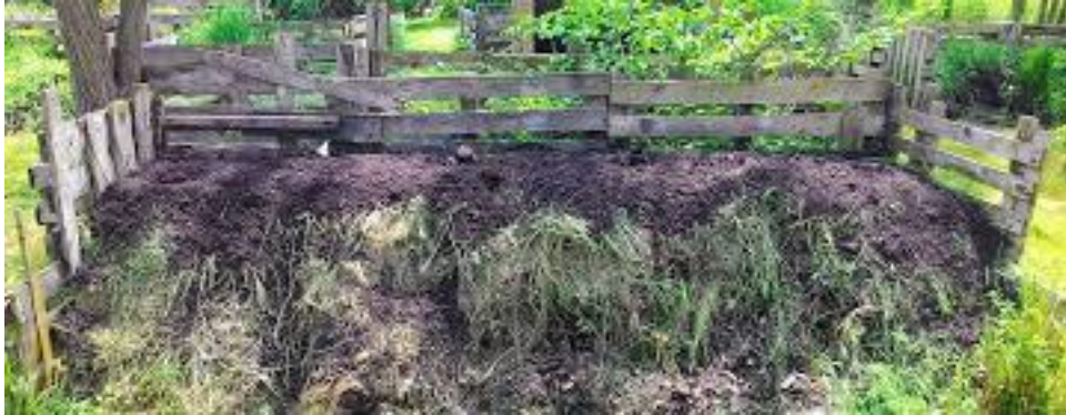
Abbildung 9 Einsatz von Pflanzenkohle bei Kompost