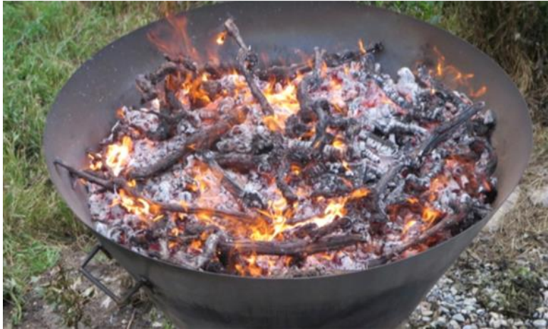
Abbildung 4 Wenn sich die oberste Biomasseschicht beginnt mit Asche zu überziehen, ist der richtige Zeitpunkt zum Nachlegen der nächsten Schicht. Unter der nächsten Schicht verkohlt die Biomasse dann vollständig

Die Arbeit mit dem Kon-Tiki bedarf folglich der beständigen Präsenz einer Person, die geschickt frische Biomasse nachlegen muss. Verpasst man den richtigen Zeitpunkt, beginnt die Kohle zu verglühen, wodurch sich der Ascheanteil der Kohle erhöht. Schichtet man zu schnell zu viel Biomasse auf, genügt das Feuer nicht, um alle Pyrolysegase einzufangen und es kommt zu Rauchentwicklung.