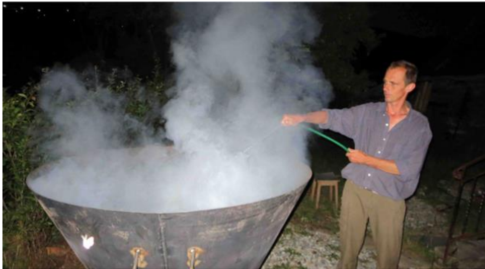
Abbildung 5 Ablöschen der obersten Glutzone mit Wasser

Etwa 20 Minuten bevor die letzte Schicht pyrolysiert ist, wird der Wasserzufluss am Boden des Kon-Tiki geöffnet. So strömt langsam von unten Wasser in den Meiler. Trifft das Wasser auf die heisse Kohle, verdampft das Wasser. Der sich schliesslich bis auf 700°C erheizende Wasserdampf steigt durch das Kohlebett auf und sorgt nicht nur für ein langames Ablöschen, sondern aktiviert die Pflanzenkohle. Durch den heissen Wasserdampf werden Kondensate aus den Poren der Pflanzenkohle ausgetrieben. Die Pflanzenkohle wird so quasi geputzt, womit das Porenvolumen und die innere Oberfläche der Kohle zunehmen. Auf diese Weise entsteht teilaktivierte Pflanzenkohle (Aktivkohle) mit Oberflächen von weit über 300m 2 pro Gramm, was höher ist, als es in den geschlossenen Systemen technischer Anlagen erreicht wird.