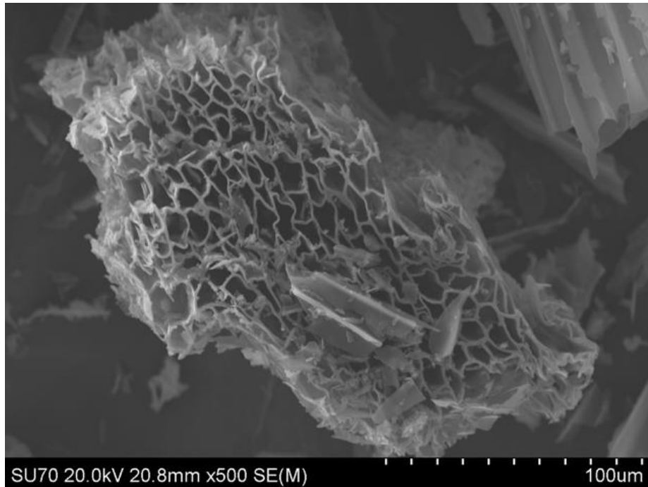
Abbildung 7 Wunderschöne offene Porenstruktur einer Kon-Tiki Pflanzenkohle.

Die Pyrolysetemperatur liegt im Kon-Tiki bei etwa 650-700°C mit kurzzeitigen Temperaturspitzen bis zu 800°C. In diesem Temperaturbereich wird die Biomasse einschliesslich ihres Ligninanteils vollständig verkohlt. Es entsteht eine Hochtemperaturkohle von hoher Qualität, die sich insbesondere in der Tierhaltung als Zusatzstoff für Futtermittel, als Einstreu, zur Güllebehandlung, für die Kompostierung, zur Trink- und Abwasserbehandlung und allgemein zur Bindung von Toxinen und flüchtigen Nährstoffen eignet. Weniger geeignet ist die Kon-Tiki-Pflanzenkohle zum direkten Einsatz im Boden, da sie als Adsorber vermutlich die labilen Nährstoffe des Bodens und Signalstoffe von Pflanzen binden würde.