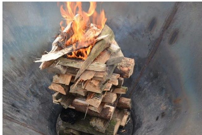
Abbildung 3 Den Holzkamin in der Mitte des Kon-Tiki von oben her entzünden

Weitere fünf bis zehn Minuten später hat sich ein ausreichend heißes Glutbett gebildet, und die Oberflächenschicht beginnt sich mit weisser Asche zu überziehen. Dies ist der Moment, um die erste Biomasseschicht aufzulegen . Sie sollte möglichst gleichmässig die Glutzone bedecken und auf keinen Fall zu dick sein. Sobald sich diese neue Biomasseschicht ebenfalls mit weißer Asche überzieht, ist dies das Zeichen, dass das meiste Holzgas entwichen ist und die entstandene Kohle zu glimmen beginnt, so dass die nächste Biomasseschicht aufgeschichtet werden kann. Dieser Vorgang des Nachlegens wird alle fünf bis zehn Minuten bis zum Ablöschen wiederholt.