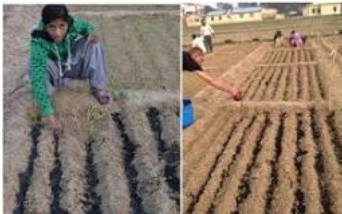
Abbildung 8 Einsatz von Pflanzenkohle auf dem Feld

Bei einer Pflanzdichte von zum Beispiel 40.000 Pflanzen pro Hektar (Pflanzabstand: 50 cm x 50 cm wie z.B. bei Tomaten oder Mais üblich) kann bei einer Aufwandmenge von nur einer Tonne pro Hektar die Wurzelzone jeder Pflanze mit 25 g (ca. 125 ml) Pflanzenkohle versorgt werden.