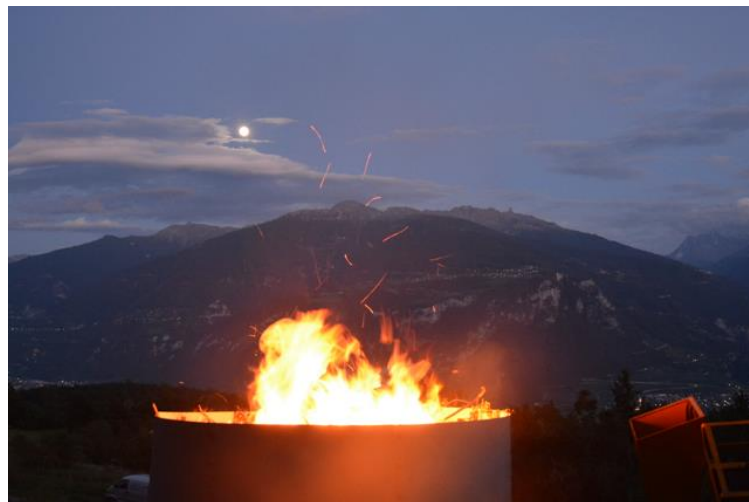
Abbildung 1 brennendes Kon-Tiki

Tonne Pflanzenkohle sind um ein Vielfaches niedriger als in den bekannten industriellen Verfahren.